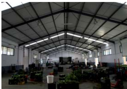
Disminución de la temperatura en la nave

Modernización de instalaciones para la mejora de la comercialización de hortalizas, con inversiones como la instalación de cubierta de techo para protección de hortalizas y trabajadores/as que mejoran la calidad de los productos ofertados a los/as clientes/as y la adquisición de diversa maquinaria que inciden en el rendimiento de envasado, del pesado y mejoran las condiciones de transporte.