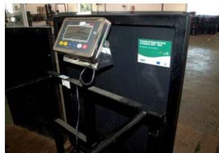
Calibradora de tomates